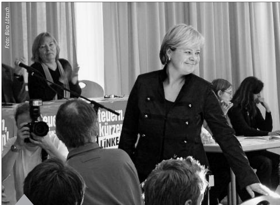
Gesine Lötzsich rief am 8. Januar auf dem Hamburger Wahlparteitag der LINKEN dazu auf, selbstbewusst in das Wahljahr zu gehen.

In unserer Partei gibt es den Konsens, dass wir in unserem Land keine zweite SPD brauchen. Was heißt das eigentlich? Die grundsätzliche Antwort ist: Unsere Vorstellung von einer gerechten Gesellschaft bleibt nicht im kapitalistischen System stecken, sondern geht