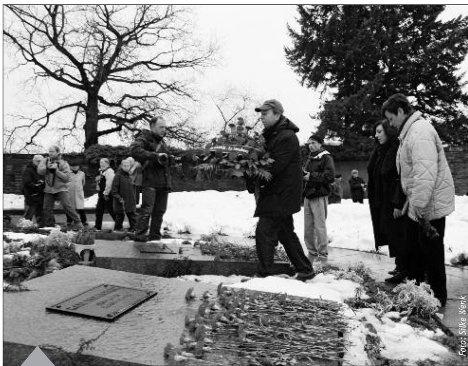
Auch in diesem Jahr waren wieder Zehntausende nach Friedrichsfelde gekommen, um Rosa Luxemburgs und Karl Liebknechts zu gedenken. Auch Mitglieder der Lichtenberger LINKEN ehrten die ermordeten Vertreter der Arbeiterbewegung.