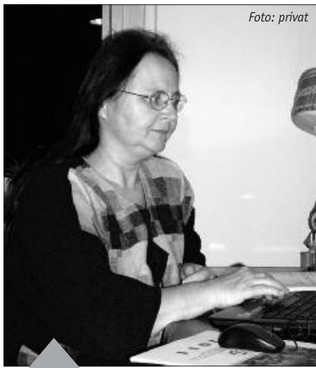
Marion Platta, umweltpolitische Sprecherin der LINKEN im Berliner Abgeordnetenhaus und direkt im Wahlkreis 3 gewählt.

Wir kommen auch gern in Basis- und Bürgerveranstaltungen. Ladet uns ein!