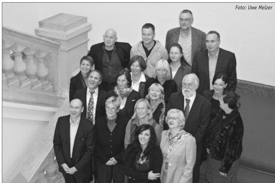
Die neue Fraktion der LINKEN im Berliner Abgeordnetenhaus hat sich konstituiert.

Wir kommen auch gern in Basis- und Bürgerveranstaltungen. Ladet uns ein!