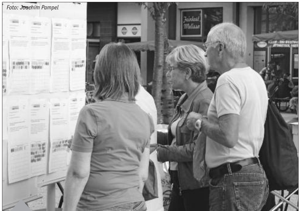
Punkteleben für die besten Projekte: Insgesamt beteiligten sich 10 500 Lichtenberger

Diese Beteiligung ist in Deutschland immer noch einmalig. Eine so umfassende Möglichkeit für Menschen, sich für eine bestimmte