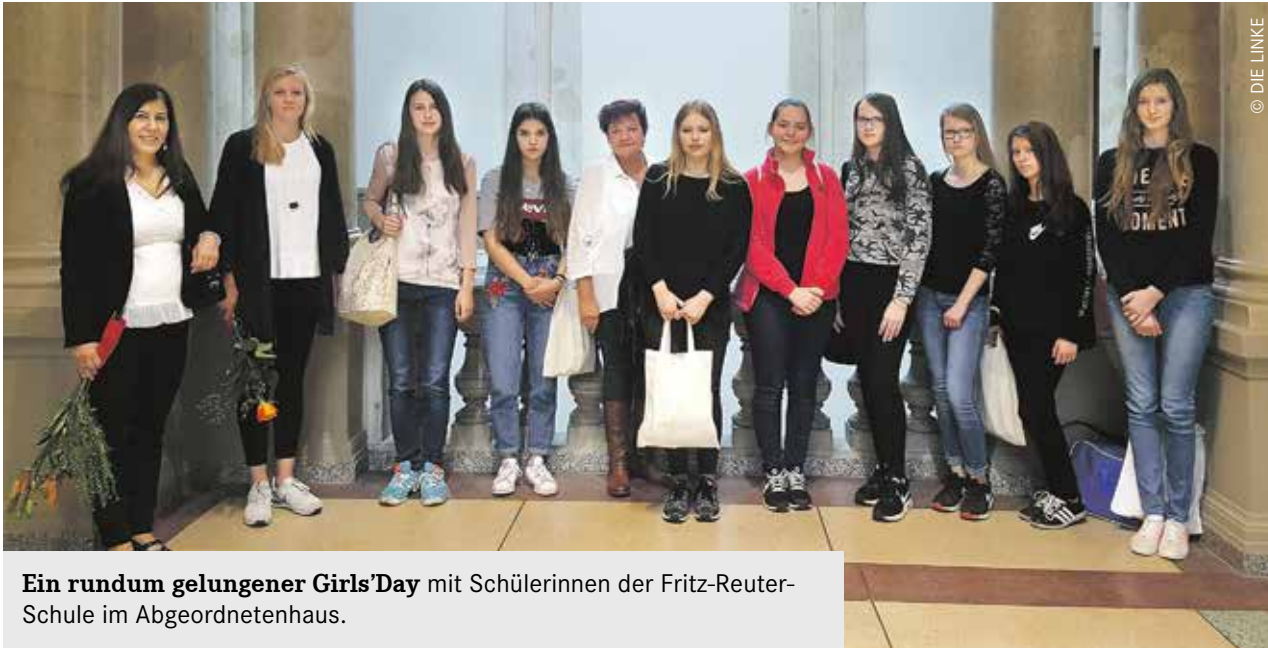
Ein rundum gelungener Girls' Day mit Schülerinnen der Fritz-Reuter-Schule im Abgeordnetenhaus.

Auch wenn der Name ähnlich klingt: Der Girls' Day ist nicht einfach nur ein „kleiner“ Frauentag. Hier geht es zwar auch um allgemeine frauenpolitische Anliegen, aber im Fokus steht ein ganz konkretes Thema: die Trennung in „Frauen-“ und „Männerberufe“. Viele Berufsfelder gelten immer noch als Männerdomäne. Zu viele. Die Idee des Girls' Day ist es, jungen Mädchen einen positiven Einblick in „männliche“ Berufsprofile zu ermöglichen und sie zu motivieren, diese bewusst zu ergreifen.