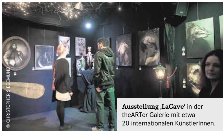
Ausstellung ‚LaCave‘ in der theARTer Galerie mit etwa 20 internationalen KünstlerInnen.