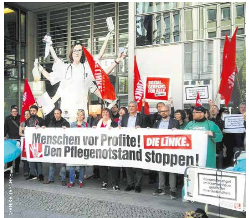
Demonstration der Partei DIE LINKE vor dem Gesundheitsministerium gegen den Pflegenotstand.