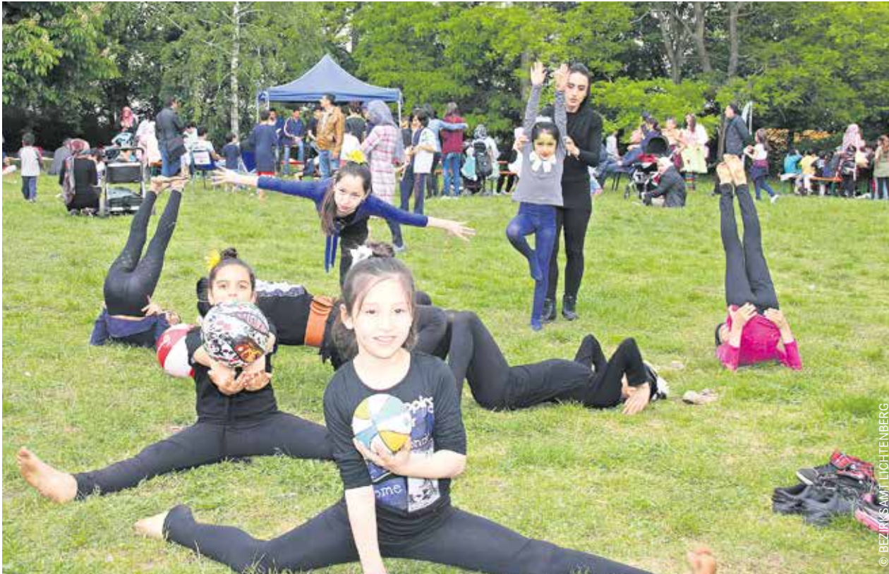
Beim Kindertag 2016 im Park am Rathaus Lichtenberg hatten diese Mädchen Spaß.