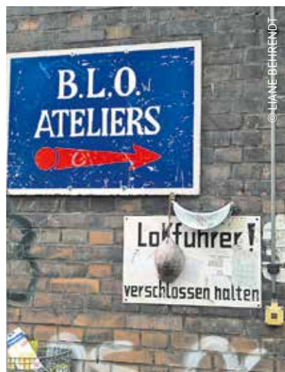
Herzlich Willkommen in den B.L.O.-Ateliers, Kaskelstraße 55.