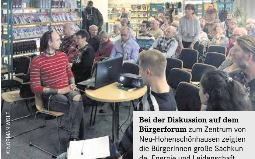
Bei der Diskussion auf dem Bürgerforum zum Zentrum von Neu-Hohenschönhausen zeigten die BürgerInnen große Sachkunde, Energie und Leidenschaft.