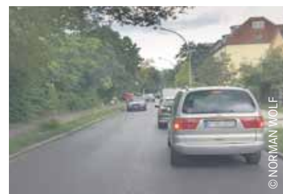
Übergangsweise wurde in der Waldowallee wegen Busverkehrs ein Halteverbot verordnet. Ergebnis: der Verkehr fließt.

Da die stadtauswärtsführende Spur auf diesem Abschnitt zugeparkt ist, entsteht hier ein Nadelöhr, das den Verkehrsfluss abrupt stoppt. Der Autofahrer, der stadtauswärts fährt, müsste den Gegenverkehr passieren