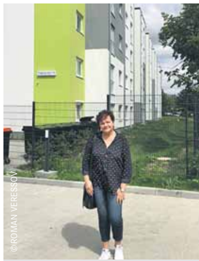
Neue Nachbarn: Geflüchtete Menschen finden ein neues Zuhause am Hagenower Ring.

142 alleinreisende Männer, 10 alleinreisende Frauen und 29 Familien aus verschiedenen Ländern (u.a. Syrien, Pakistan, Afghanistan, Irak), insgesamt 255 Personen (Stand: 21.8.), haben hier ein neues Zuhause gefunden. Die meisten leben bereits seit über einem Jahr in Deutschland, alle haben eine Aufenthaltserlaubnis. Alle neuen BewohnerInnen kommen aus der Gemeinschaftsunterkunft in der Salvador-Allende-Straße 89-91 und kennen sich daher schon. Betreut werden sie vom Team des Betreibers mitHilfe GmbH, das mit 11 MitarbeiterInnen nun vollständig ist.