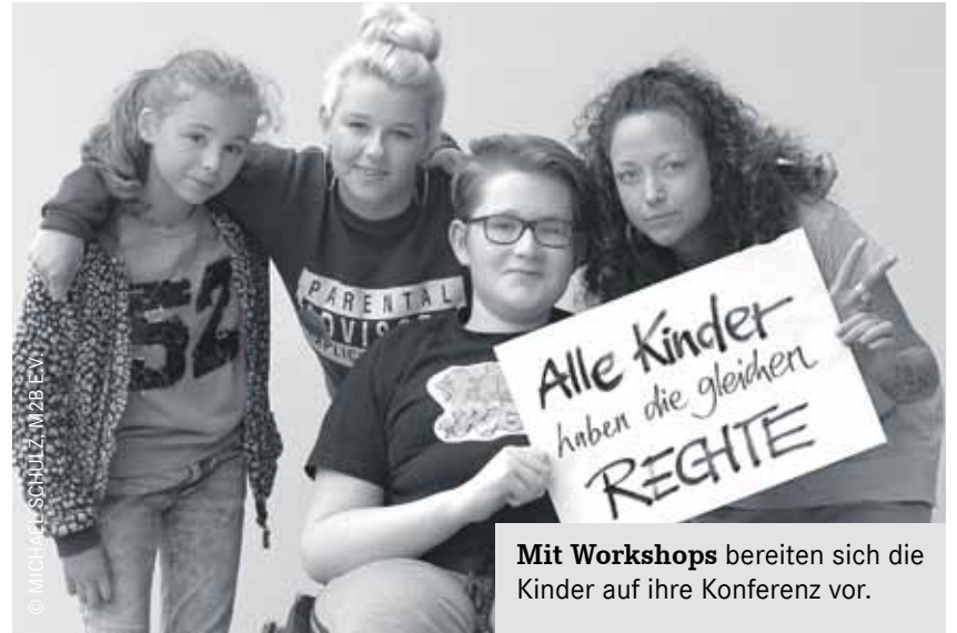
Mit Workshops bereiten sich die Kinder auf ihre Konferenz vor.

Die Kinderrechte bunt und somit sichtbarer zu machen ist ein wichtiger Schritt auf dem Weg, die Kinderrechte im Grundgesetz zu verankern. Deshalb findet am 4. Oktober 2017 die nunmehr 5. Kinderkonferenz im Humboldthaus in der Warnitzer Straße 13A statt.