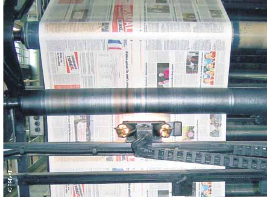
Monatlich 20.000 Zeitungen kommen aus der Druckerei bis in die Lichtenberger Haushalte.