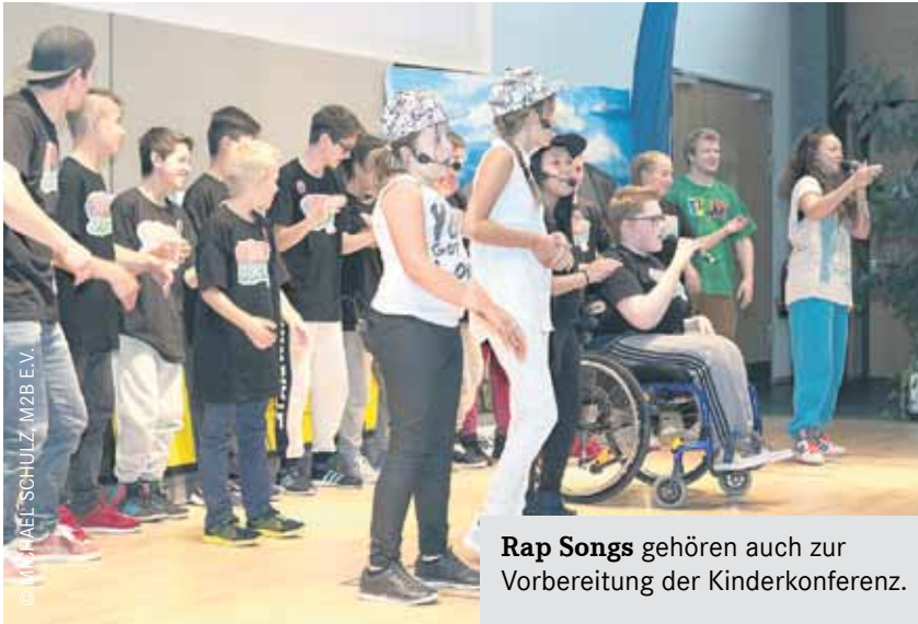
Rap Songs gehören auch zur Vorbereitung der Kinderkonferenz.