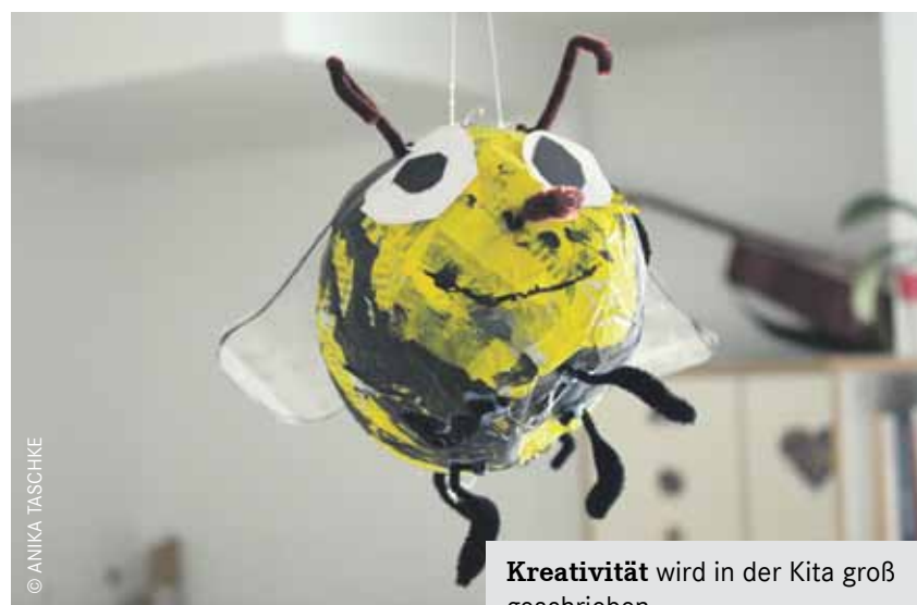
Kreativität wird in der Kita groß geschrieben.

Die Kita Krokofant in der Mellenseestraße 65/66 hat derzeit Platz für 166 Kinder. In den nächsten Jahren soll sie vergrößert werden, so dass ab 2019 220 Kinder in der Kita betreut werden können. In dieser Kita wird täglich selbst gekocht und gemeinsam gefrühstückt. Eltern müssen ihren Kindern nichts mitgeben - das entlastet auf der einen Seite die Eltern und auf der anderen Seite erhalten so alle Kinder dasselbe Essen. In der Kita Zwergtaucher hingegen werden die schön gepackten Brotbüchsen morgens zusammen geöffnet und gemeinsam gefrühstückt. Hier steht eine zuckerfreie und gesunde Ernährung im Vordergrund. Die Kita wurde neu renoviert und besteht seit 2,5 Jahren in der Gehrenseestraße 99. Das Besondere: Für die zahlreichen Kinder mit Migrationshintergrund bietet die Kita Sprachför-