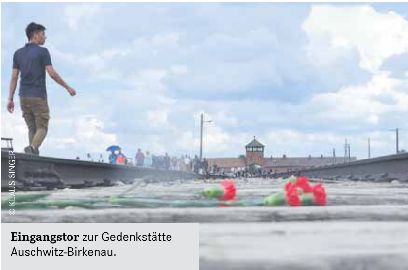
Eingangstor zur Gedenkstätte Auschwitz-Birkenau.

Seit über 12 Jahren schreibt die LINKE Bundestagsabgeordnete Gesine Löttsch den antifaschistischen Jugendwettbewerb „Zivilcourage vereint“ mit anderen FraktionskollegInnen, unterstützt durch Privatpersonen, aus. Acht junge Frauen und Männer zwischen 15 und 30 Jahren gingen in diesem Jahr auf die Auszeichnungsfahrt. Sie führte uns nach Krakau und Warschau, um die Spuren