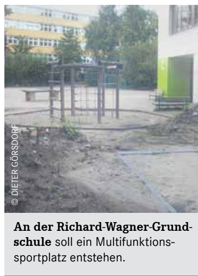
An der Richard-Wagner-Grundschule soll ein Multifunktionssportplatz entstehen.

Seit Jahren kämpft die Fraktion DIE LINKE in der BVV Lichtenberg für mehr Freiräume in den Schulen des Bezirkes. Es können nicht nur mehr Kinder in den Schulen aufgenommen werden, sondern es müssen auch die sozialen Voraussetzungen an den Schulen dafür geschaffen werden. An der Richard-Wagner-Grundschule wurde im Jahr 2015 ein zusätzliches Schulgebäude, ein sogenannter Modularer Ergänzungsbau errichtet, und zwar auf der Fläche, wo früher eine kleine Sportanlage existierte. Da es im Karlshorster Umfeld keinen Sportplatz gibt, kam von den Eltern der Vorschlag, solch einen Platz im Schulbereich wieder einzurichten. Dieser Wunsch wur-