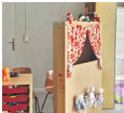
Auch ein Spielzimmer gibt es im Hohenschönhausener Tempohome.