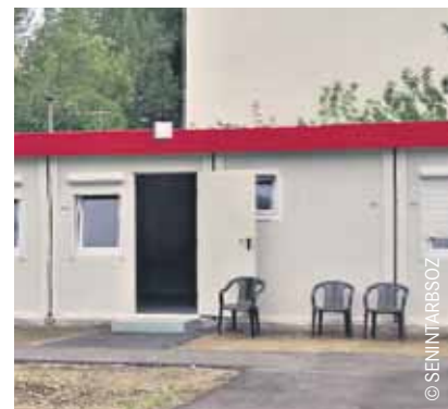
Die BTB Bildungszentrum GmbH ist Träger des Tempohomes.