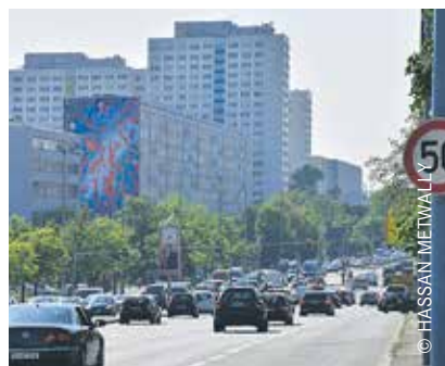
Die Frankfurter Allee ist ein Verkehrsknotenpunkt.

Die Zahlen machen deutlich, dass die vergangenen Jahre für Lichtenberg auch verkehrspolitisch verlorene Jahre gewesen sind. Darum ist es besonders wichtig, dass der neue Mitte-Links-Senat sich im Koalitionsvertrag auf eine Vielzahl von Maßnahmen für eine zukunftsorientierte Verkehrsstruktur in Berlin verständigt hat, die auch die Verkehrssicherheit steigern wird. Danach sollen Rotlicht- und Ge-