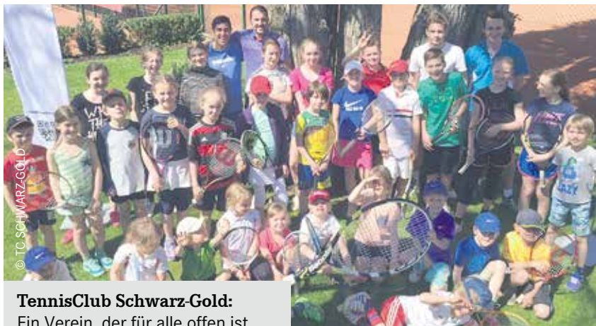
TennisClub Schwarz-Gold: Ein Verein, der für alle offen ist.

Seit genau 90 Jahren (1927) schwingt der Tennisschläger im Tennisclub Schwarz-Gold Berlin. Aktuell trainieren hier in Hohenschönhausen rund 330 Mitglieder, von denen etwa 100 Kinder und Jugendliche sind. Dabei zeichnet sich der Club nicht zuletzt auch durch seine interkulturelle Mitgliedschaft aus. Hier kommen Leute aus Russland, Vietnam, Frankreich,