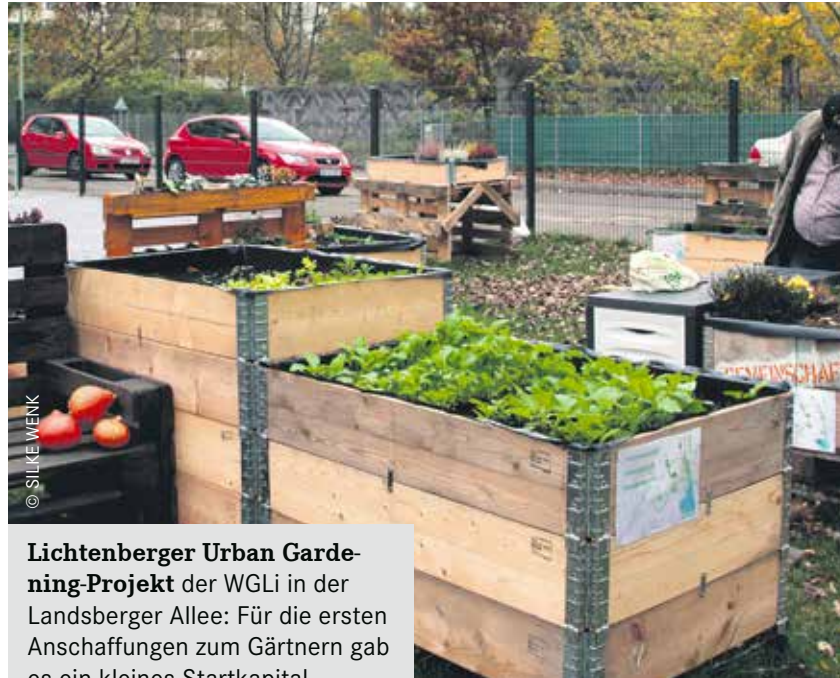
Lichtenberger Urban Gardening-Projekt der WGLi in der Landsberger Allee: Für die ersten Anschaffungen zum Gärtnern gab es ein kleines Startkapital.

von Kindern der umliegenden Kindergärten gemeinsam genutzt werden. So können die Jüngsten erfahren, wie Pflanzen wachsen, gepflegt werden müssen und wie geerntet wird.