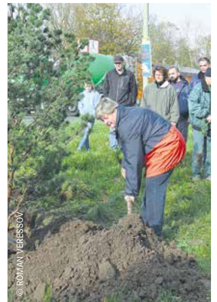
Malchow e.V. und Synanon pflanzten eine Kiefer in der Malchower Dorfstraße.